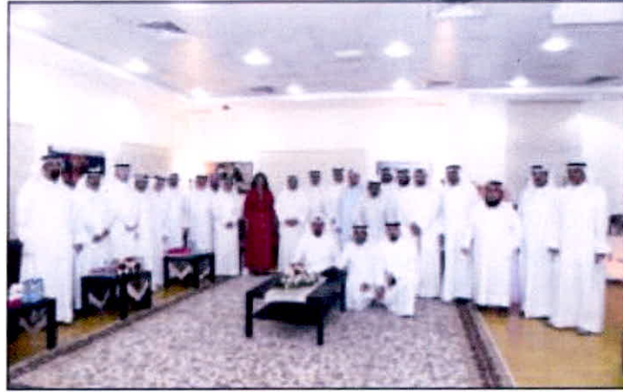
المتحدثون في لقطة جماعية